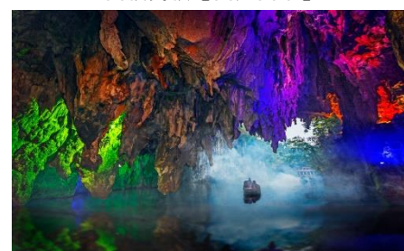
喀斯特地貌【龍宮景區】