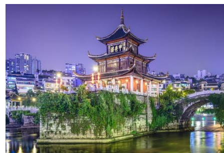
貴陽市的市徽【甲秀樓】