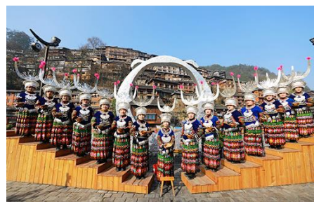
苗族民族【西江苗寨】