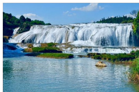
黃果樹大瀑布上游【陡坡塘瀑布】